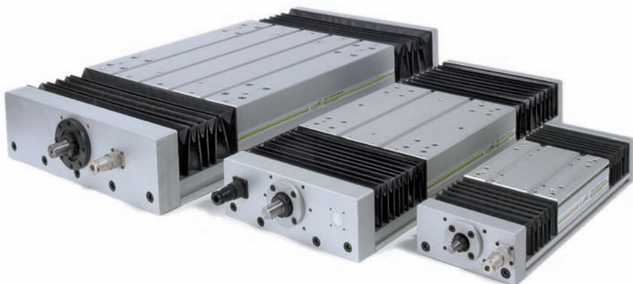
Tavole lineari e moduli "Bi-Rail" a marchio MOVITEC, prodotti da Impex Tecniche Lineari.